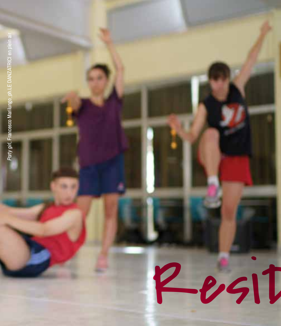
Party girl, Francesco Marilungo_ph.LE DANZATRICI en plein air