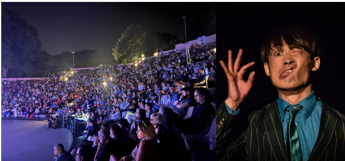
La Finale di sabato 15 luglio 2023

K(-A-)O, corto vincitore di TR8